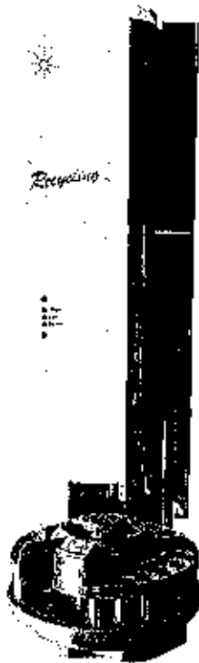
ALS 7693A seul

7693A, ALS controller is rated for mains connection 100-120 VAC or 220-240 VAC, 50/60 Hz, 180VA