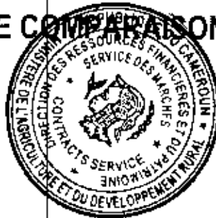
TABLEAU DE COMPARAISON DES OFFRES